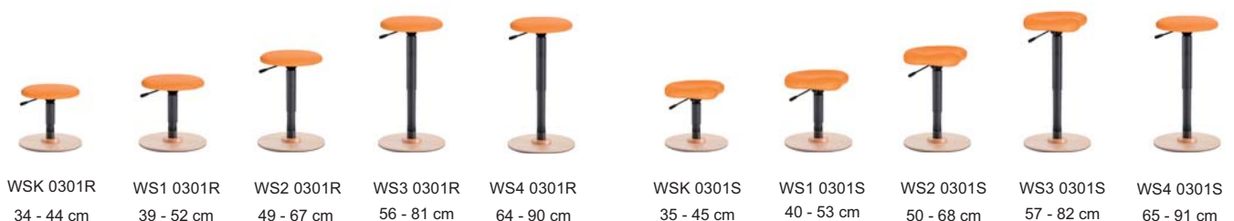
WSK 0301R 34 - 44 cm

Gestalten Sie Ihr Wunschmodell im Online Shop ergoshop.at