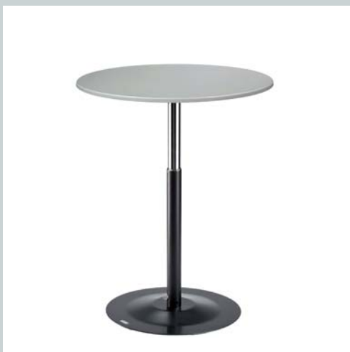
Art. Nr.: TP 80 KU+TS F65 S+TF 550 S