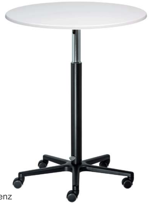
Art. Nr.: TR 01F6580

Er ist in zwei Ausführungen erhältlich: feststehend mit Tellerfuß oder mit Fußkreuz und feststellbaren Rollen.