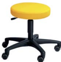
ROLKKI F60 MED 38 - 48 cm