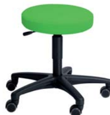
ROL1KI F60 MED 44 - 58 cm