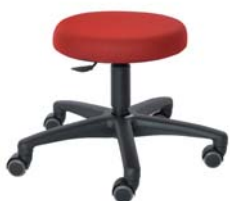
ROLKKI F60 MESH 38 - 48 cm

Gestalten Sie Ihr Wunschmodell im Online Shop ergoshop.at