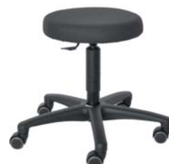
ROL2KI F60 MESH 46 - 65 cm