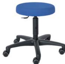
ROL1KI F60 MESH 44 - 58 cm