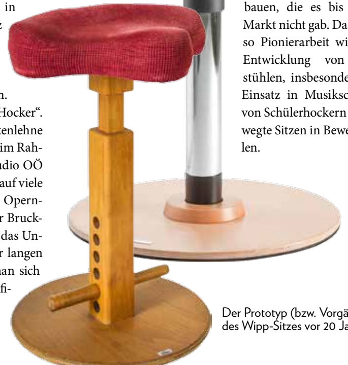
Der Prototyp (bzw. Vorgänger) des Wipp-Sitzes vor 20 Jahren

Wir hatten immer ein Ohr für Wünsche und Anregungen von Anwendern, daher hat sich unser Programm rasch erweitert. So kamen wir auf die Idee, ErzieherInnenstühle für den Einsatz in Kindergärten zu bauen, die es bis dahin am Markt nicht gab. Das war ebenso Pionierarbeit wie auch die Entwicklung von Musikerstühlen, insbesondere für den Einsatz in Musikschulen und von Schülerhockern für das Bewegte Sitzen in Bewegten Schulen.