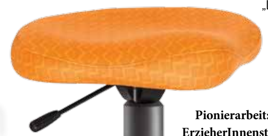
Pionierarbeit: ErzieherInnenstühle, MusikerInnenstühle, Bewegtes Sitzen für die Bewegte Schule

Wir hatten immer ein Ohr für Wünsche und Anregungen von Anwendern, daher hat sich unser Programm rasch erweitert. So kamen wir auf die Idee, ErzieherInnenstühle für den Einsatz in Kindergärten zu bauen, die es bis dahin am Markt nicht gab. Das war ebenso Pionierarbeit wie auch die Entwicklung von Musikerstühlen, insbesondere für den Einsatz in Musikschulen und von Schülerhockern für das Bewegte Sitzen in Bewegten Schulen.