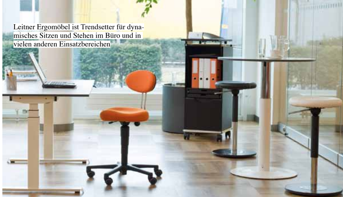
Leitner Ergomöbel ist Trendsetter für dynamisches Sitzen und Stehen im Büro und in vielen anderen Einsatzbereichen