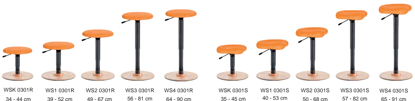
WSK 0301R 34 - 44 cm

Gestalten Sie Ihr Wunschmodell im Online Shop ergoshop.at