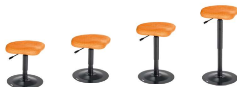
WSKS 9101XL 34 - 44 cm WS1S 9101XL 39 - 52 cm WS2S 9101XL 49 - 67 cm WS3S 9101XL 56 - 81 cm