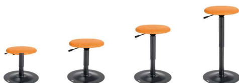
WSKS 9101R 33 - 43 cm WS1S 9101R 38 - 51 cm WS2S 9101R 48 - 66 cm WS3S 9101R 55 - 80 cm

Gestalten Sie Ihr Wunschmodell im Online Shop ergoshop.at