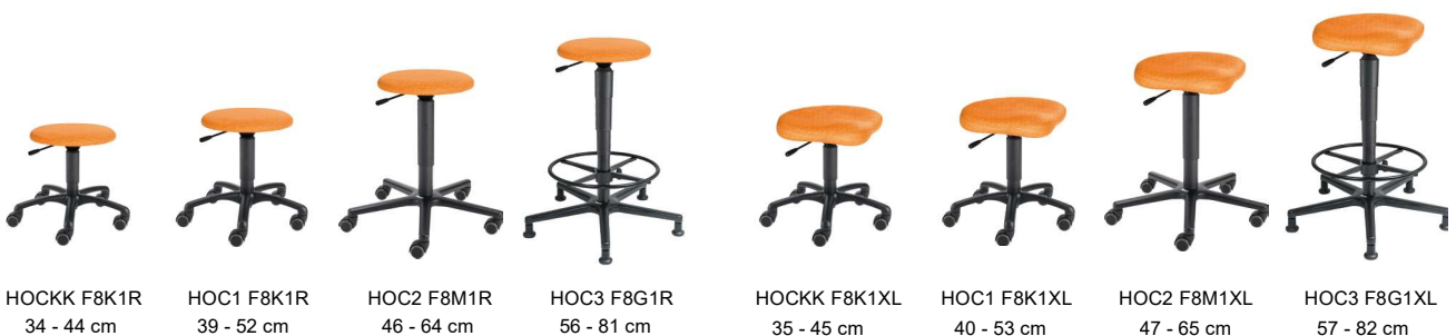
HOCKK F8K1R 34 - 44 cm

Gestalten Sie Ihr Wunschmodell im Online Shop ergoshop.at