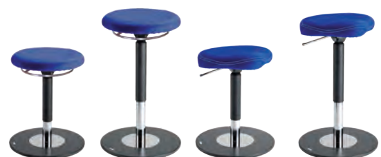
SP2 0702R 47 - 66 cm