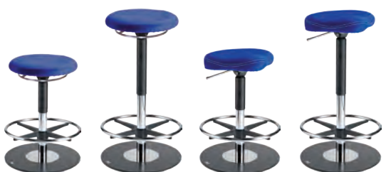
BAR2 7702R 45 - 64 cm

Gestalten Sie Ihr Wunschmodell im Online Shop ergoshop.at