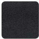
KF 8033 schwarz

Der optimale Objektstoff mit den bewährten Trevira CS Eigenschaften. Perfekter Sitzkomfort durch hohe Atmungsaktivität, hohe Scheuerfestigkeit und Lichtechtheit. Schwer entflammbar, schadstofffreie Trevirafaser, die alle wichtigen internationalen Brandschutznormen erfüllt und mit Farbbrillanz und Pflegeleichtigkeit überzeugt. > 100.000 Scheuertouren nach Martindale