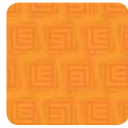
LD 01 marigold