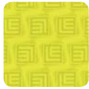
LD 02 lime