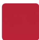
PE 78 rot