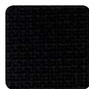
NA 46 nero