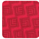
LD 03 rosewood