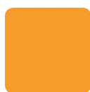
PE 79 gelb