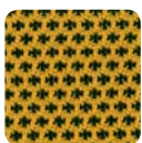
DM 05 gelb