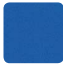
KF 6011 türkisblau