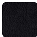
PE 99 schwarz

PERI ist ein hochwertiges, phthalatfreies Vinyl Polstermaterial. Es zeichnet sich durch exzellente Lichtechtheit, Abriebeigenschaften und Pflegeleichtigkeit aus. Es ist desinfizierbar, feuchtigkeitsabweisend, Speichel- und Schweißsecht, Urin- und Blutbeständig. Phthalatfreie Objektkunstleder sind besonders empfohlen für Einsatzbereiche mit Kindern als auch für den Gesundheits- und Wellnessbereich. > 55.000 Scheuertouren nach Martindale