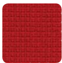
NA 43 rosso