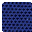
DM 04 blau