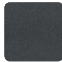
KF 8010 anthrazit