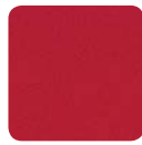
KF 4008 rot