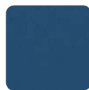
PE 14 blau