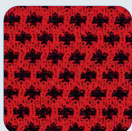
DM 02 rot