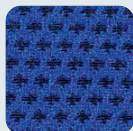
DM 04 blau