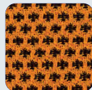
DM 06 orange