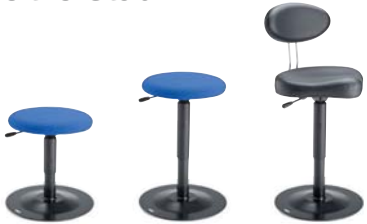
WS1S 9101R 37 - 50 cm WS2S 9101R 47 - 65 cm WS2S 9101XL +RL 49 - 67 cm

LeitnerStabil ist der bevorzugte Hocker für den Musikschulunterricht.