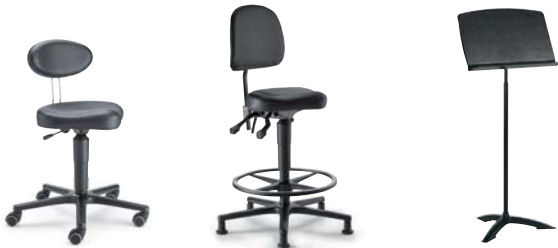
TW2 F8M1XL 47 - 65 cm MVS3 F8G1XL 56 - 81 cm Nähere Informationen auf Anfrage!