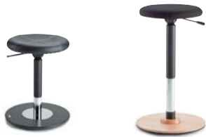
SP2 0702R 50 - 70 cm WS3 0301R 55 - 80 cm

Die vielseitigen Sitzalternativen mit beweglichem Sockelteller sind ideal für die Probenarbeit zu Hause.