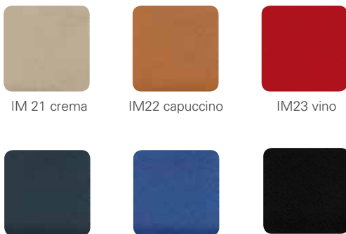
IM 21 crema IM22 capuccino IM23 vino IM24 mare IM27 aqua IM26 notte

Softig weich und angenehm im Sitzkomfort, pflegeleicht und makellos. Imitato fühlt sich an wie Leder und sieht aus wie Leder. Es zeichnet sich aus durch exzellente Lichtechtheit, Wasserdampfdurchlässigkeit und Pflegeleichtigkeit. Zudem ist es antimikrobiell ausgerüstet, desinfizierbar und feuchtigkeitsabweisend. Ideal auch für den Gesundheits- und Wellnessbereich.