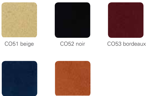
CO51 beige CO52 noir CO53 bordeaux CO54 bleu CO55 orange

Mit der bewährten, hochwertigen Stoffqualität aus dem Hause Gabriel werden Sie lange Freude haben. Comfort ist besonders weich, anschmiegsam und pflegeleicht. Dieser Stoff ist antistatisch und schmutzabweisend ausgerüstet. Mit 50.000 Scheuertouren nach Martindale ist er außergewöhnlich strapazfähig. Die optimale Mikrofaser für den Einsatz im Objektbereich.