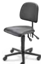
MV2 F8M1XXL 47 - 65 cm