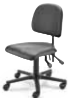
MV1 F8M1XXL 40 - 53 cm