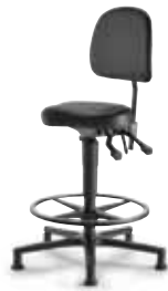
MVS3 F8G1XL 56 - 81 cm