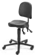
MVS2 F8M1XL 47 - 65 cm