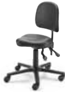
MVS1 F8M1XL 40 - 53 cm