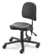
MVSK F8M1XL 35 - 45 cm