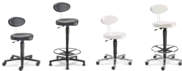
TW2 F8M1XL 47 - 65 cm