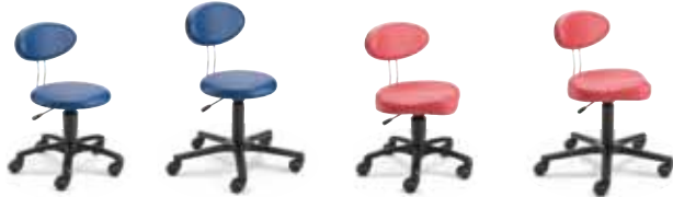
TWK F8K1R 33 - 43 cm